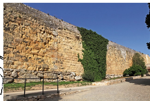
Un pan de mur, vestige du portique qui ceinturait la terrasse intermédiaire