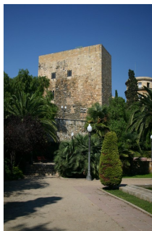
Le Prétoire, l'une des deux tours érigées au sud de la terrasse intermédiaire

Parmi les éléments découverts dans cette zone, notons deux boucliers qui devaient décorer les portiques. L'un représente Méduse, l'autre Jupiter et ils sont conservés au musée archéologique de Tarragone.